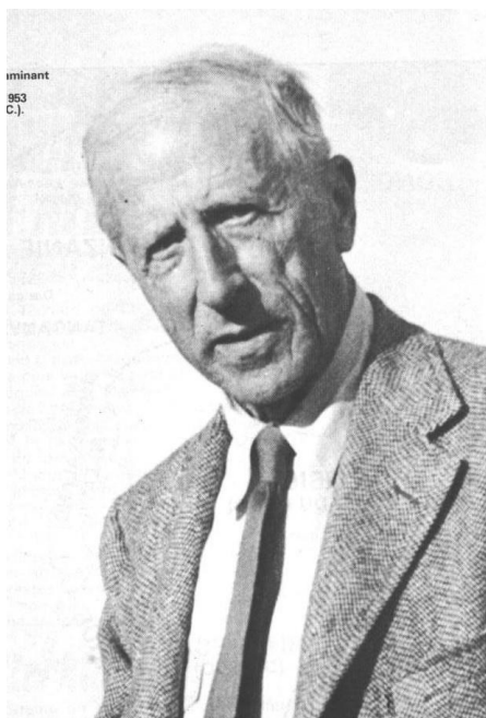
Teilhard en 1953