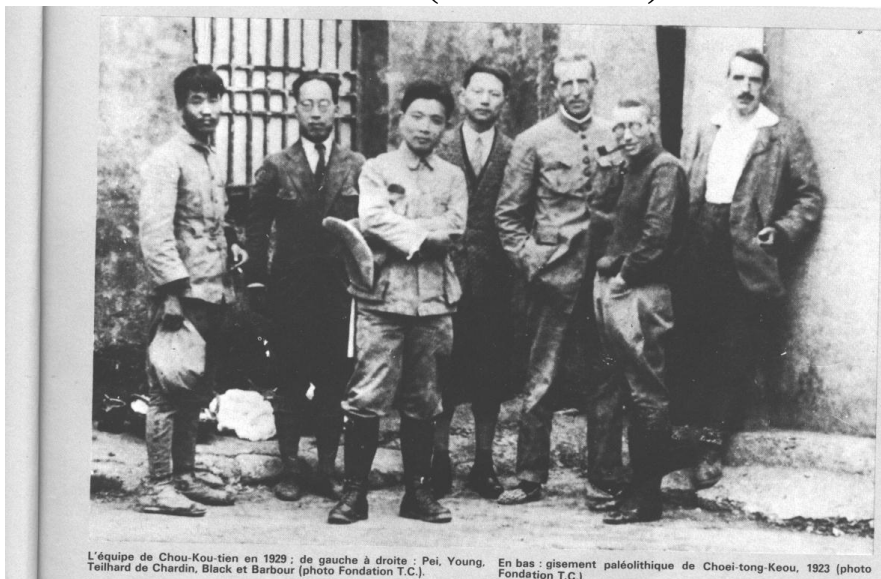
L'équipe de Chou-Kou-tien en 1929 : de gauche à droite : Pei, Young, Teilhard de Chardin, Black et Barbour (photo Fondation T.C.). En bas : gisement paléolithique de Choei-tong-Keou, 1923 (photo Fondation T.C.).

1931-1932 Participa en el "El Crucero Amarillo" de la fundación Citroën en Asia.